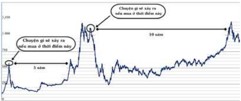
Hình 2. Biểu đồ Vnindex

1. Tôi đã hơi “khôn” khi chọn thời điểm mua là ngày 28/07/2000 khi VN-Index ở mức thấp nhất (100 điểm). Không phải ai cũng có đủ điều kiện để chọn đúng thời điểm đẹp như vậy: chưa có tiền, chưa hiểu rõ về cổ phiếu, chưa có kinh nghiệm... Hãy xem kỹ đồ thị sau: